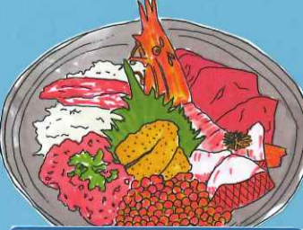
イラストはイメージです